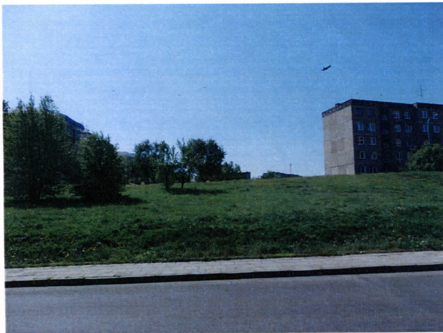
Widok działki nr 127/6 od strony ul. Kilińskiego