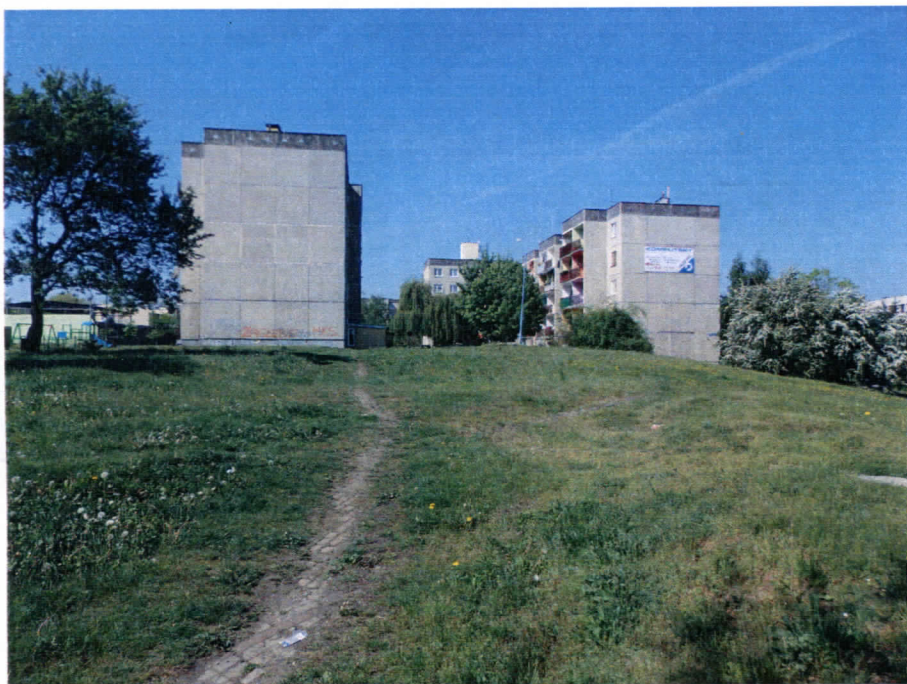
Widok działki nr 127/6 ze strony południowo - wschodniej