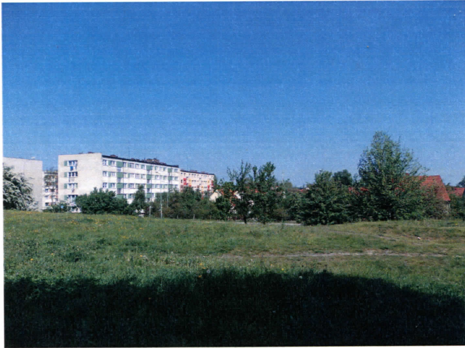
Widok działki nr 127/6 od strony południowej, w kierunku ul. Kilińskiego