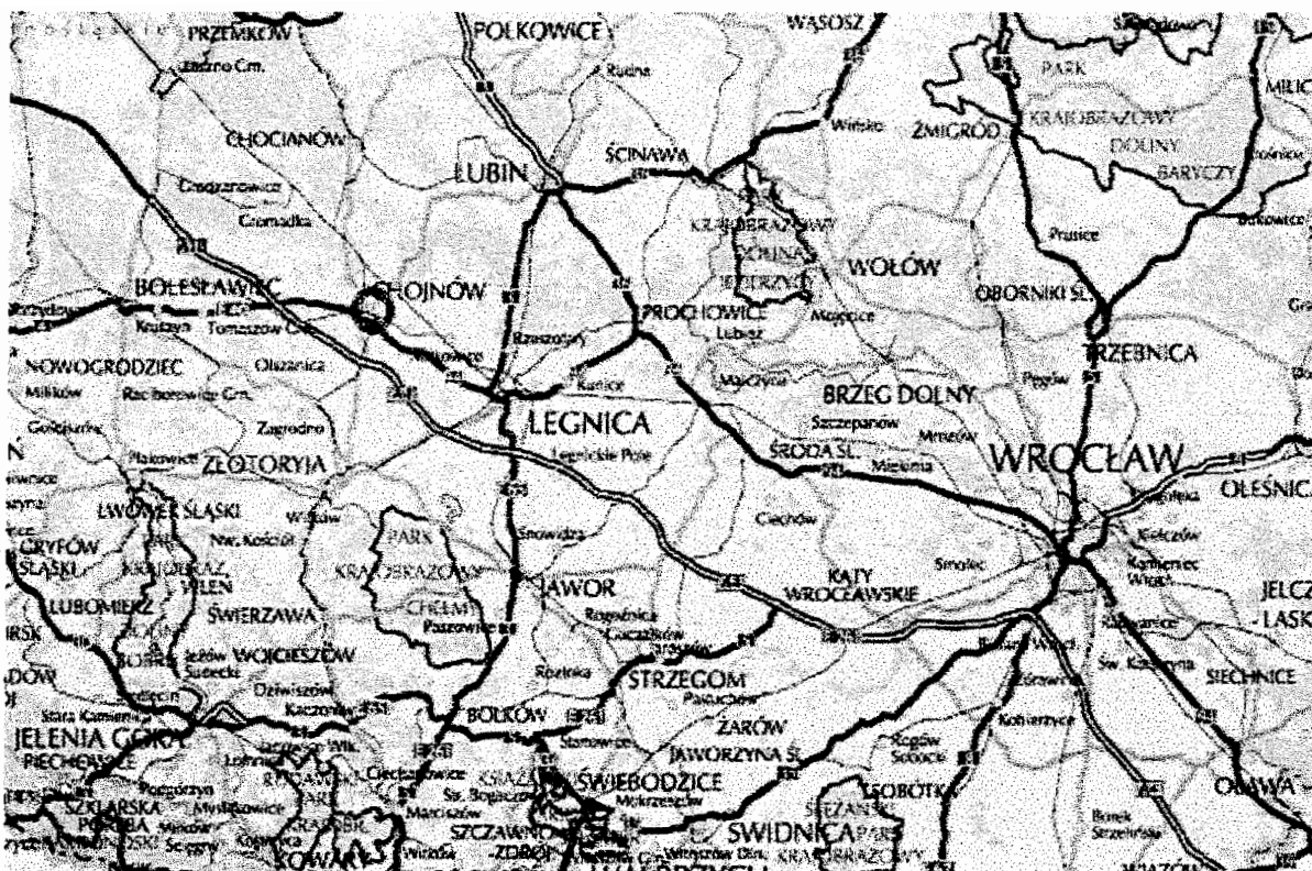
Rysunek 1. Położenie i otoczenie geograficzne Chojnowa.

Gmina Miejska Chojnow liczy 14446 mieszkańców, z czego 7036 osób to mężczyźni, a 7410 osób to kobiety. Gęstość zaludnienia w 2006 roku wynosiła 3665,2 osoby na 1 km 2 . Przyrost naturalny wynosił w tym roku 1% na 1000 mieszkańców, co klasyfikowało miasto na 4 miejscu wśród gmin miejskich województwa dolnośląskiego.