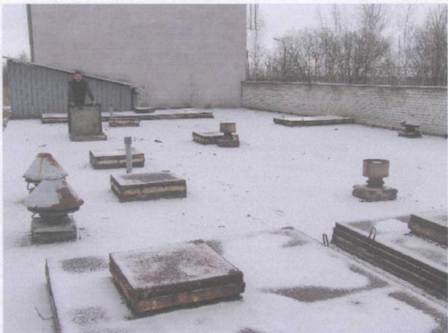
Podziemny magazyn północny