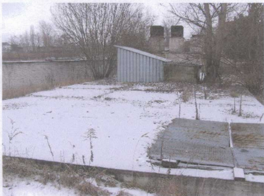
Podziemny magazyn południowy