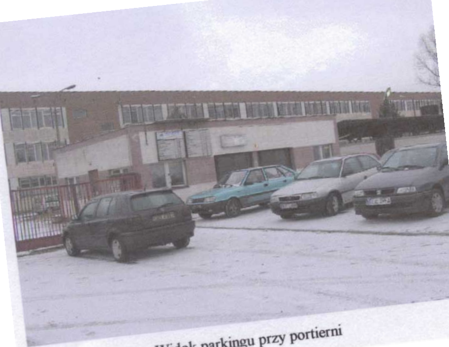
Widok parkingu przy portierni