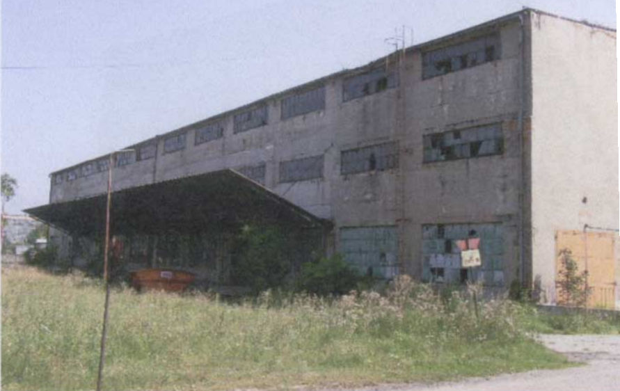
Widok budynku od strony południowo – zachodniej