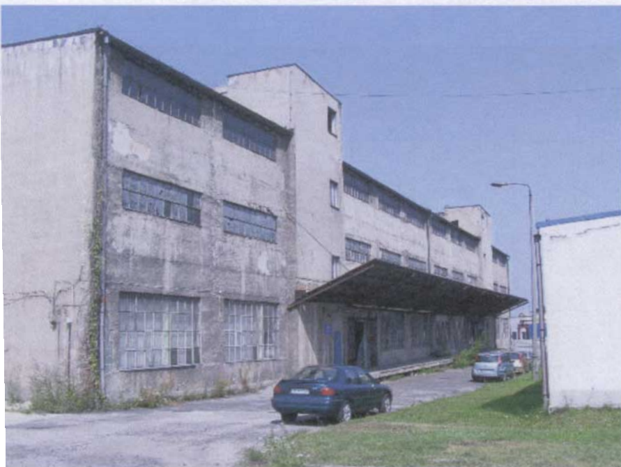
Widok budynku od strony południowo – wschodniej