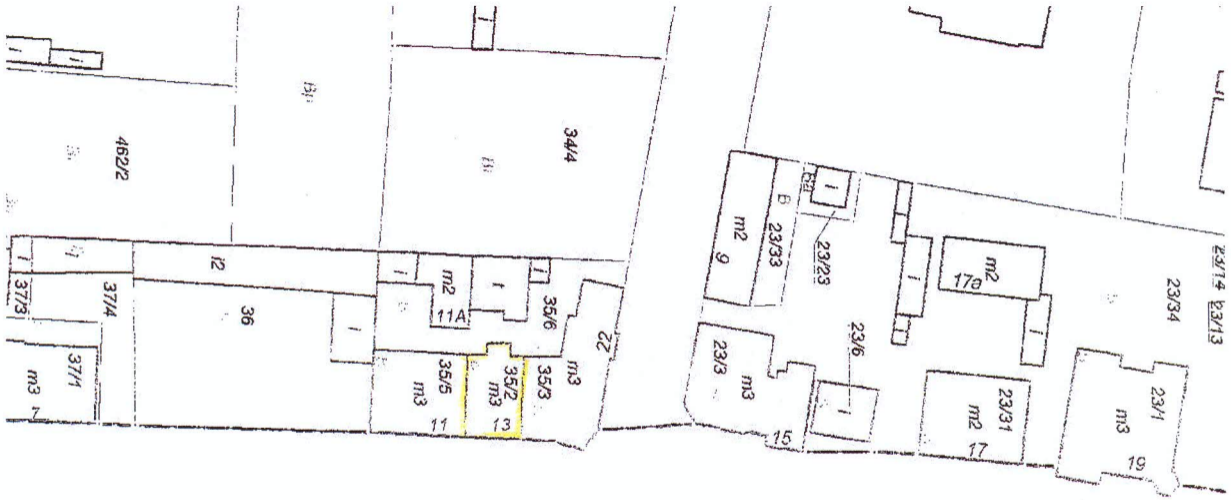
Działka nr 35/2 na mapie ewidencji gruntów