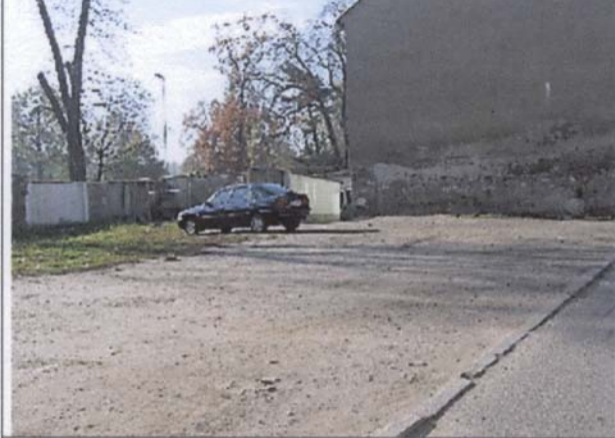
P i l l 311/9