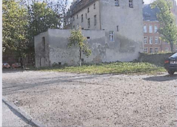
P i l l 311/9