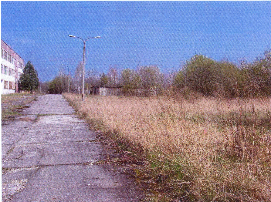
Widok działki nr 22/53 od strony południowo - zachodniej