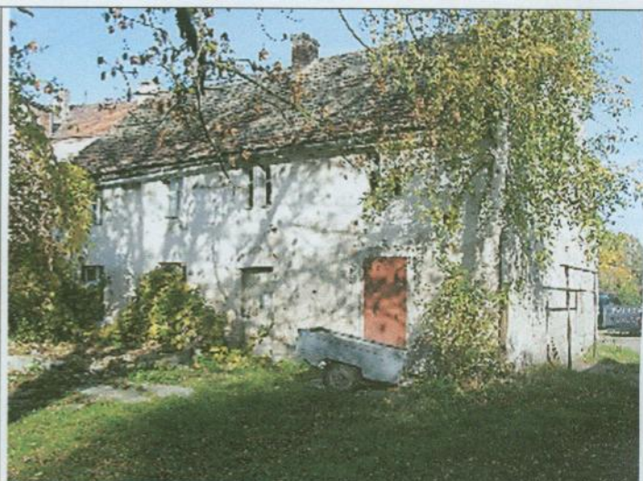
Widok południowej elewacji