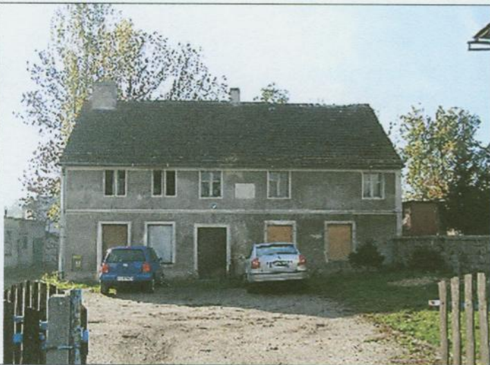
Widok północnej elewacji