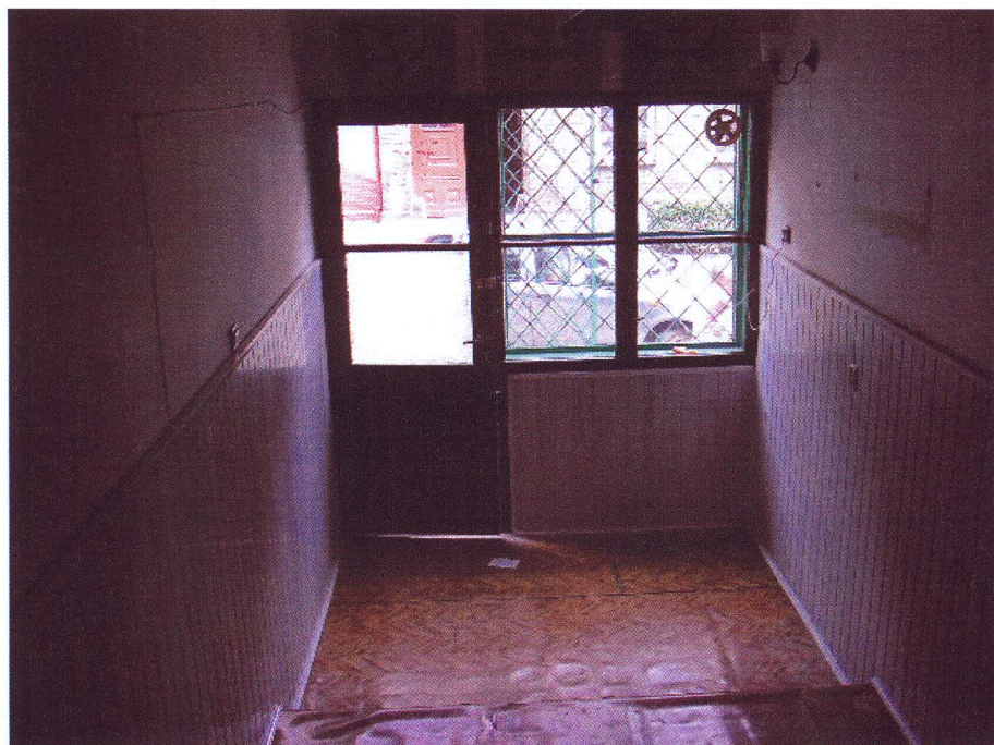
Pomieszczenie 2 z wejściem do lokalu