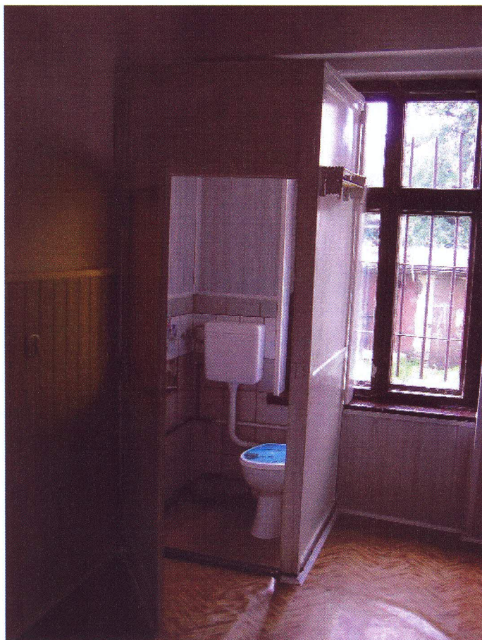
Pomieszczenie 1 z wc za drewnianym przepierzeniem