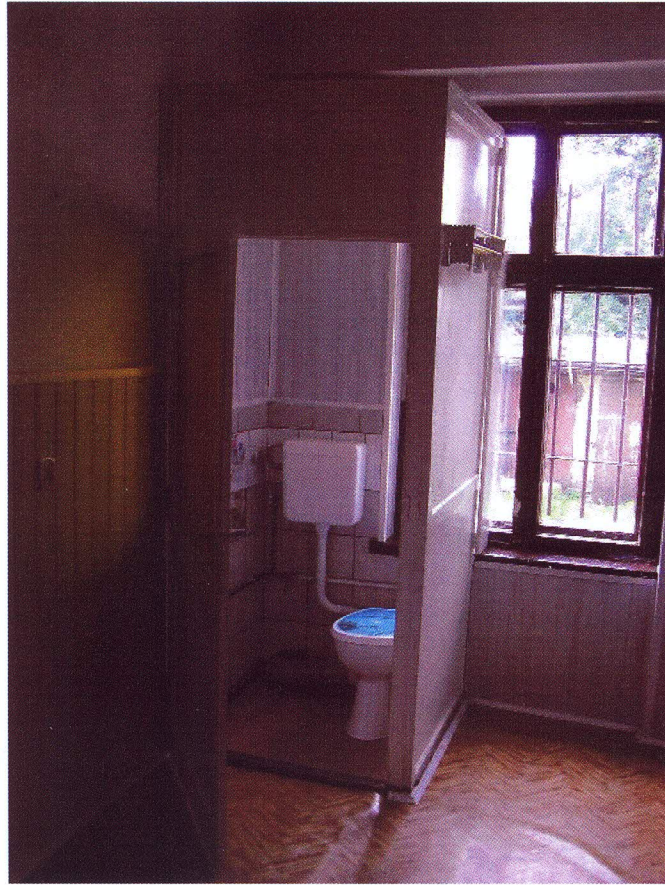
Pomieszczenie 1 z wc za drewnianym przepierzeniem