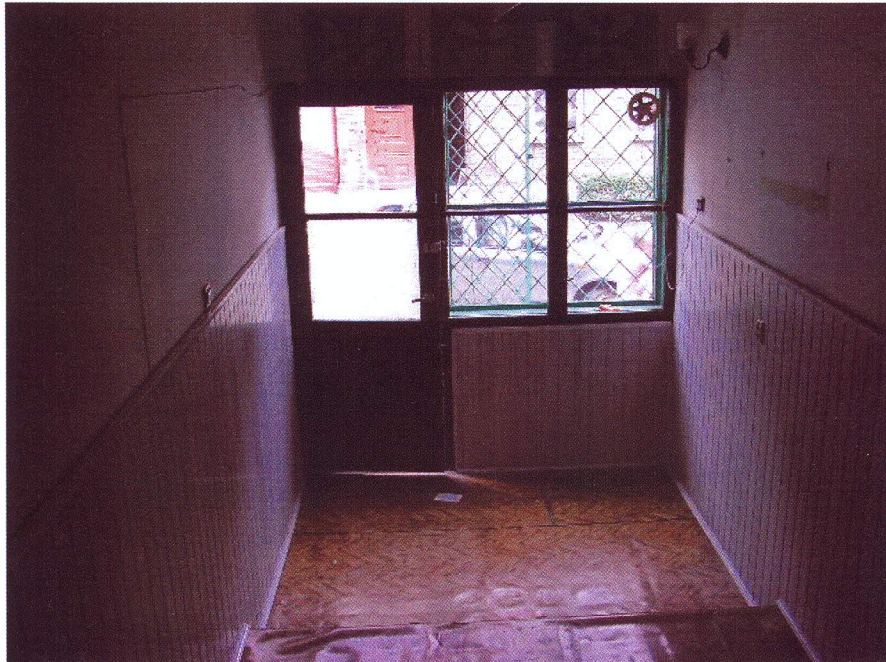
Pomieszczenie 2 z wejściem do lokalu