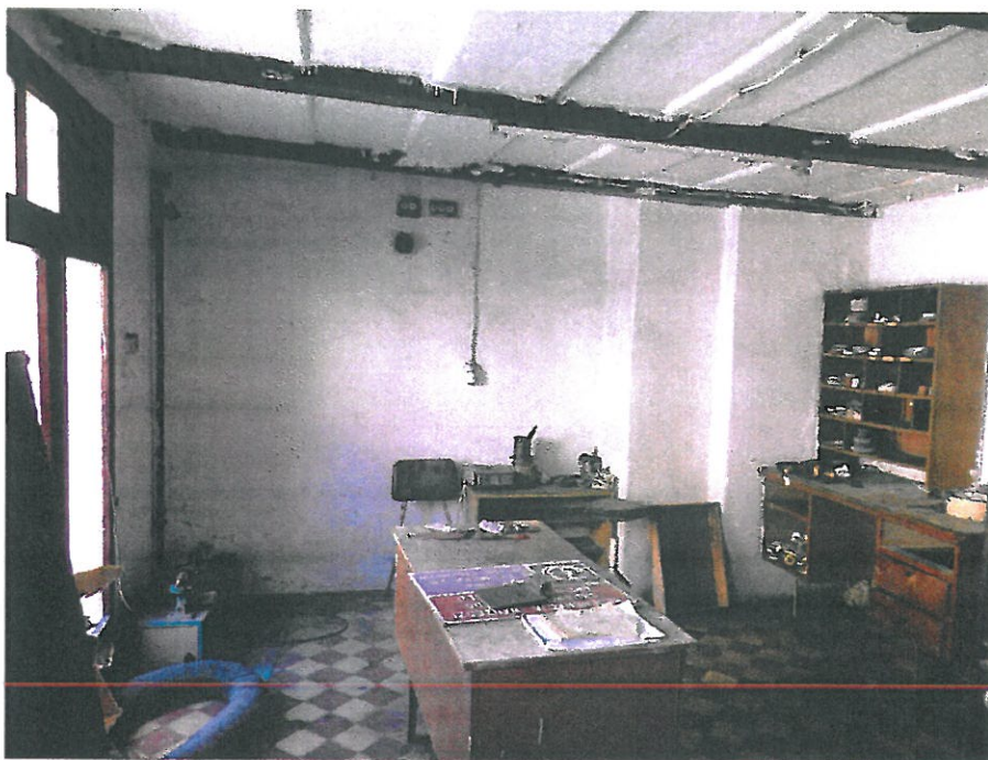
Pomieszczenie usługowe nr 1