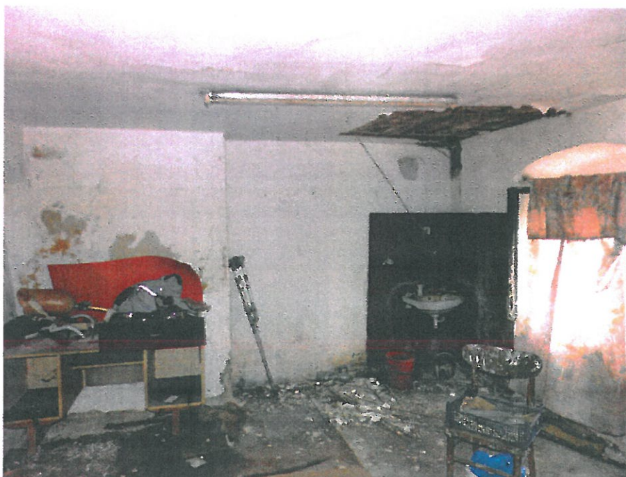
Zaplecze nr 2