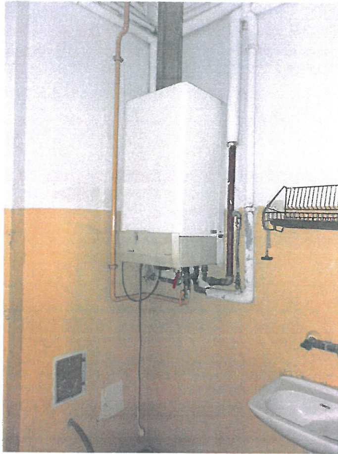
Pomieszczenie nr 1