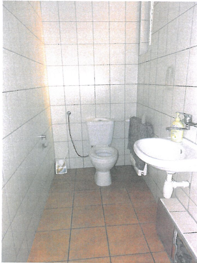
WC nr 6