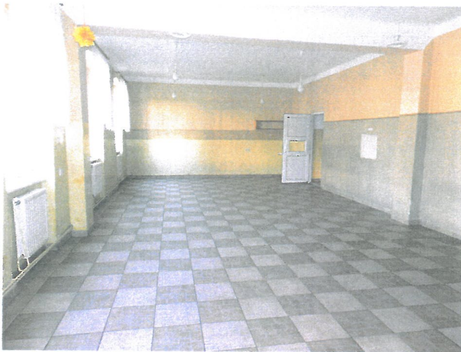
Pomieszczenie nr 10