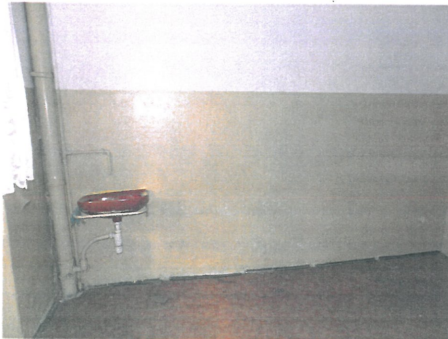
Pomieszczenie nr 13