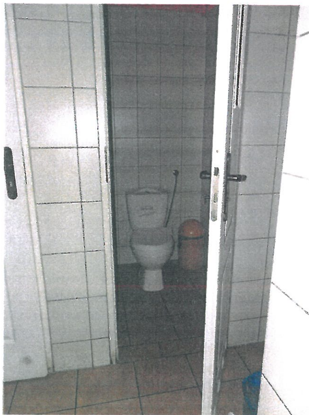
WC nr 7