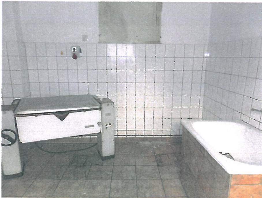
Pomieszczenie nr 3