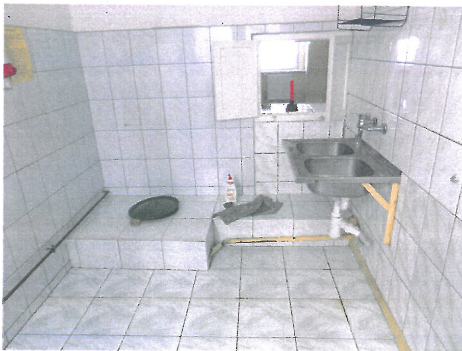
Pomieszczenie nr 5