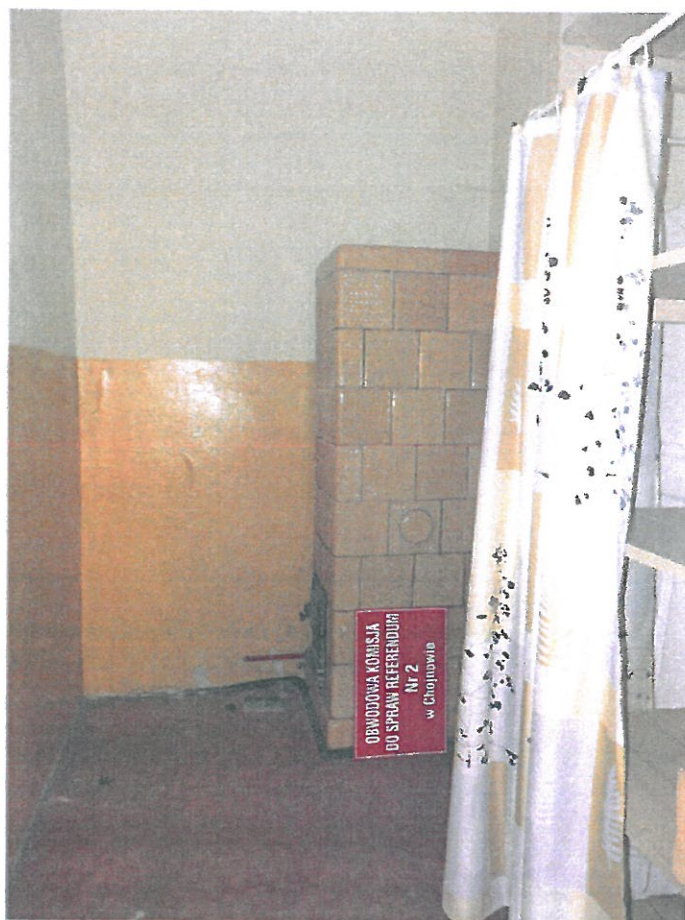
Pomieszczenie nr 14 przynależne