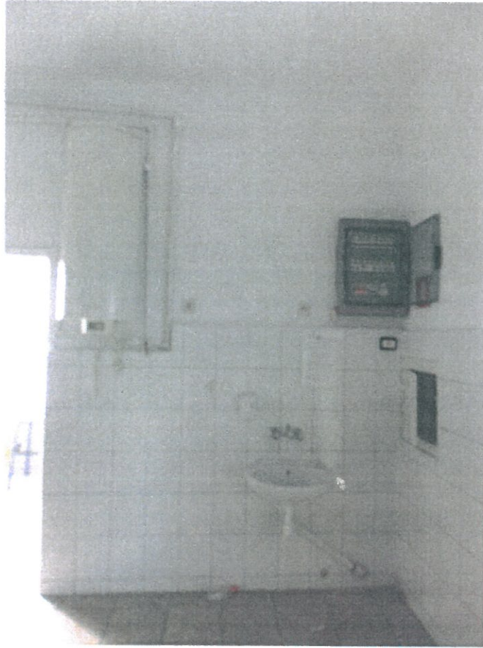
Pomieszczenie nr 4