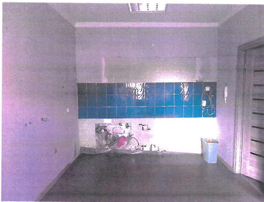
Pomieszczenie nr 1