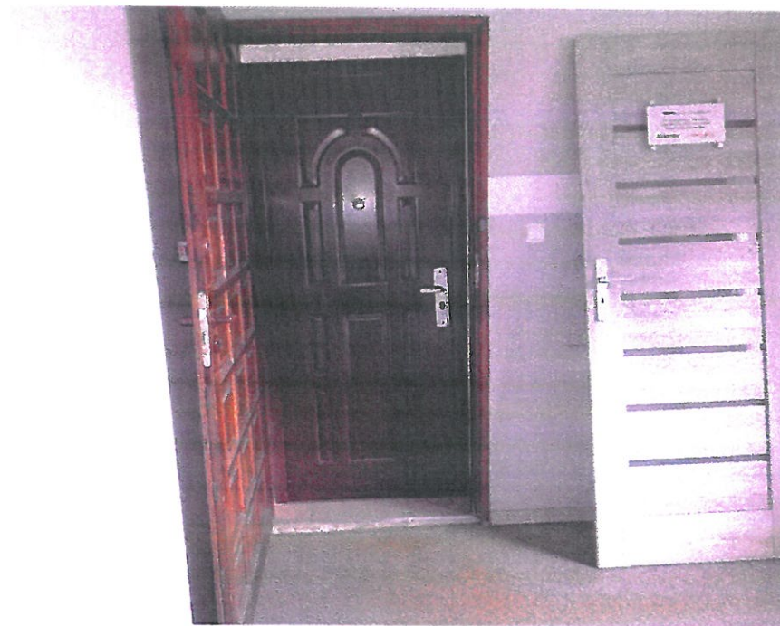
Pomieszczenie nr 3