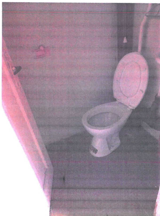
WC (część wspólna) – strona północna od podwórza