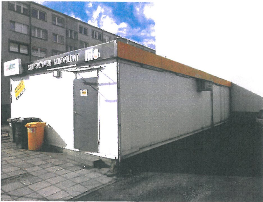
Widok pawilonu od strony północno – wschodniej