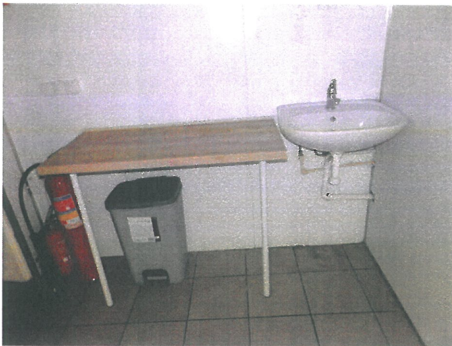
Magazyn – część zachodnia