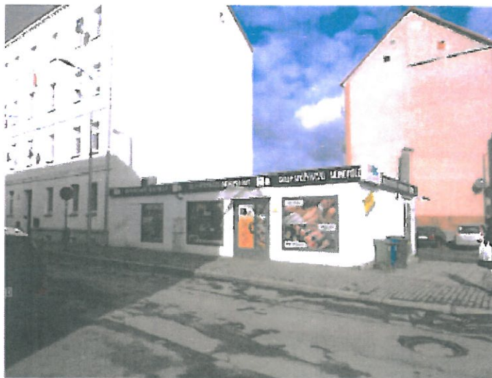
Widok pawilonu od strony południowej