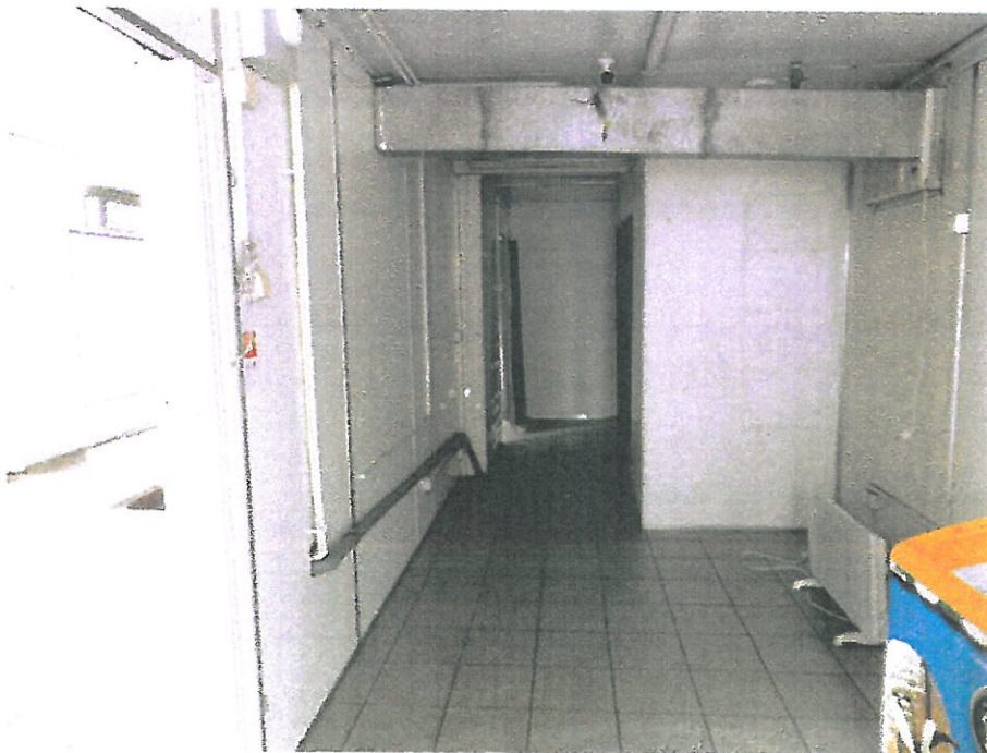
Magazyn – część wschodnia