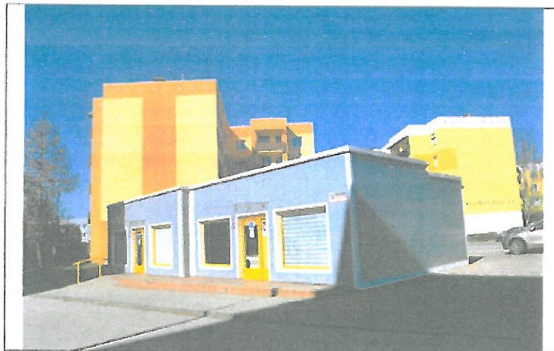
Widok pawilonu od strony południowej