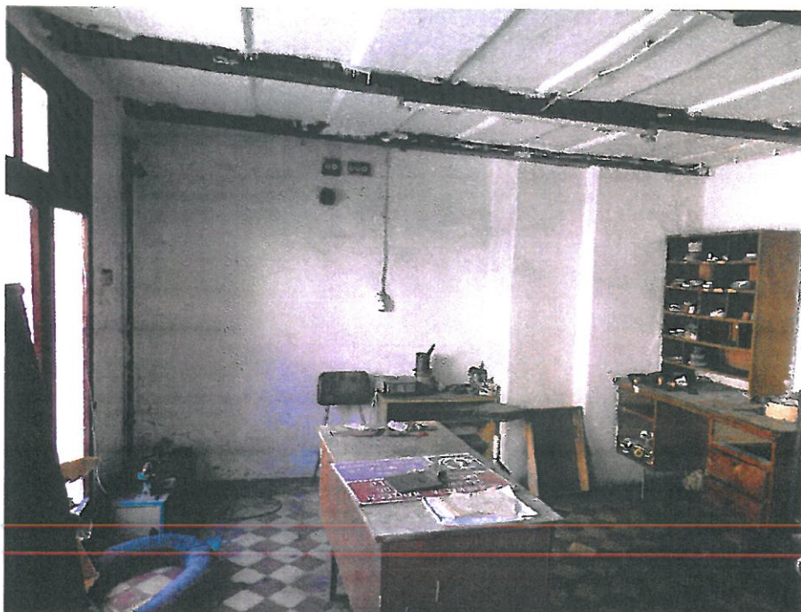
Pomieszczenie usługowe nr 1