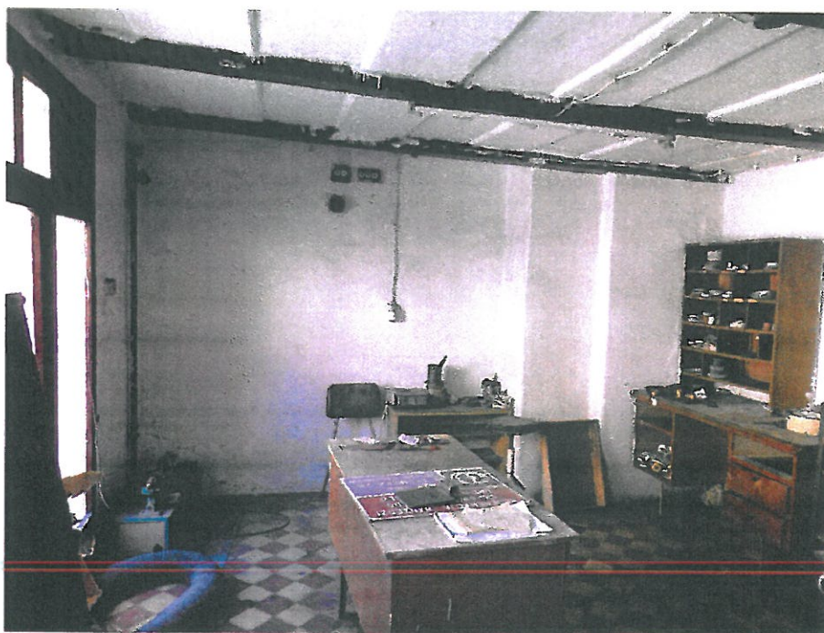
Pomieszczenie usługowe nr 1